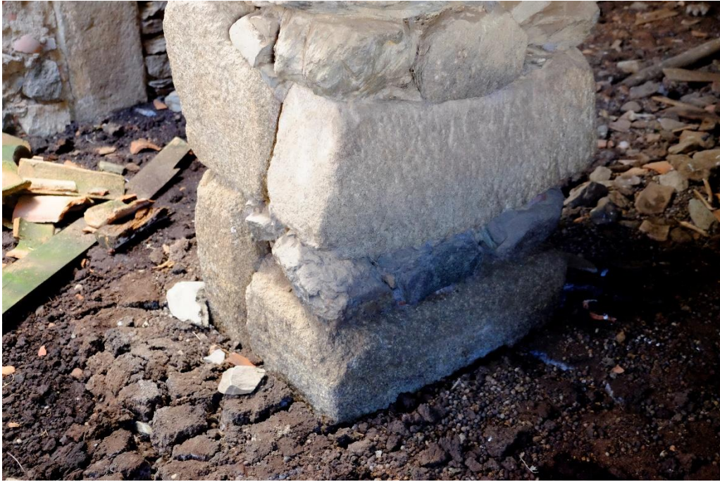
Fig. 5. Restos de columna de la nave