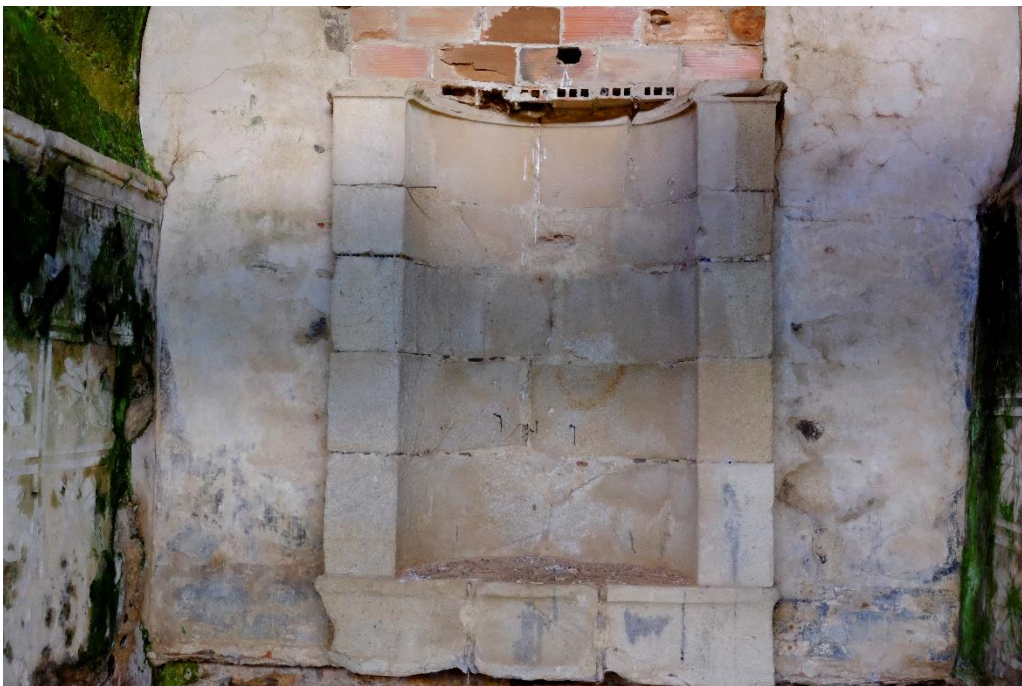
Fig. 6. Hornacina, cabecera