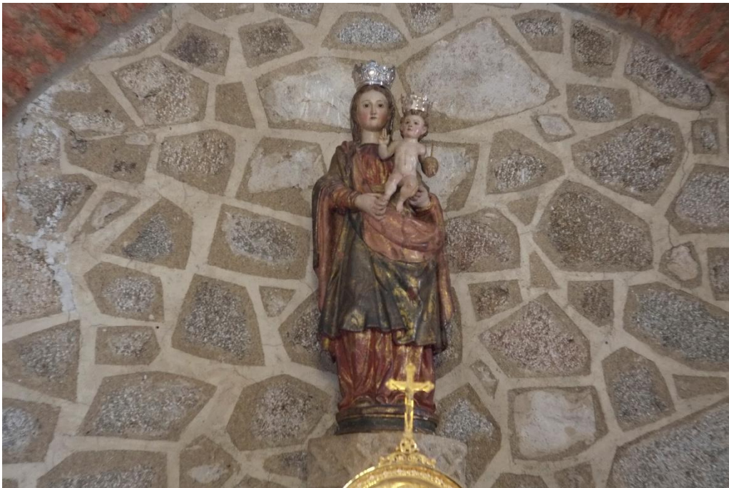
Fig. 10. Virgen de Portera, obra de Sebastián de Paz (1613)