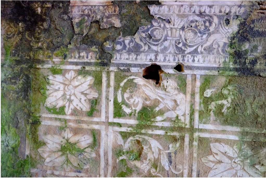
Fig. 9. Restos de esgrafiados