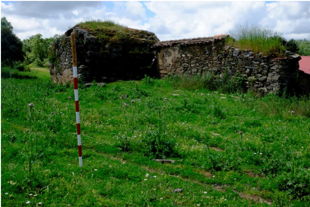
Fig. 2. Ermita de la Portera