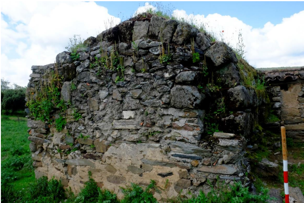
Fig. 4. Ábside