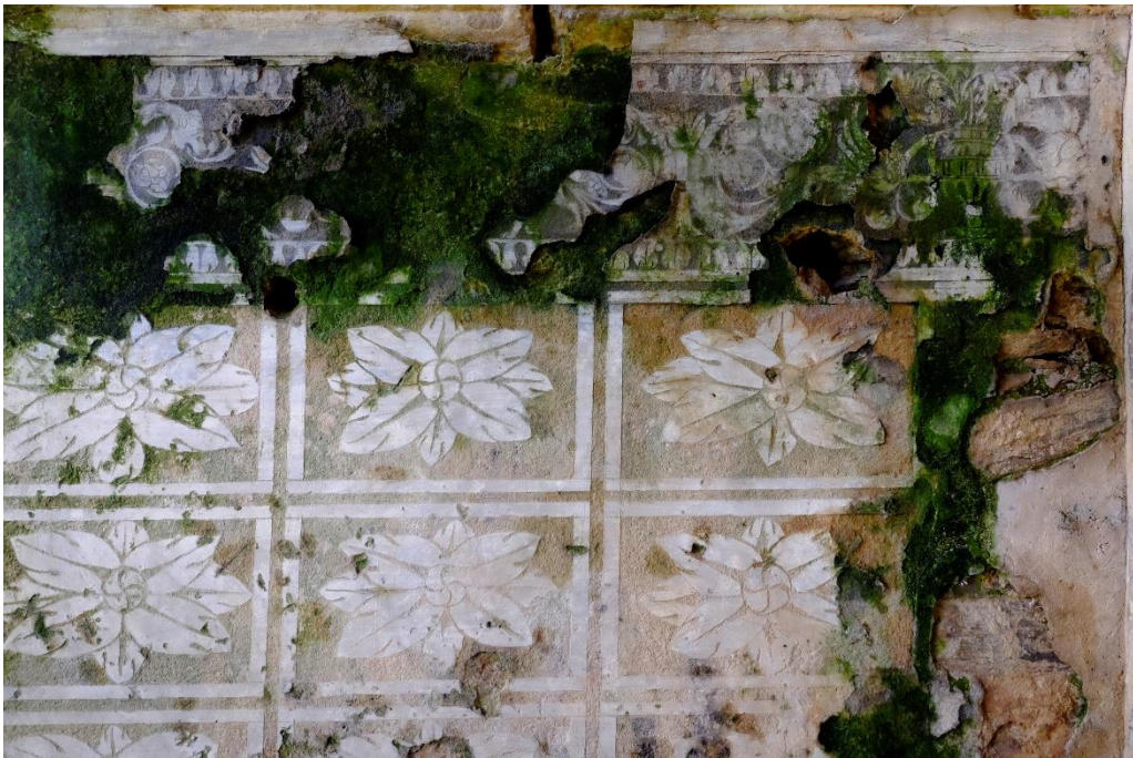
Fig. 8. Esgrafiados