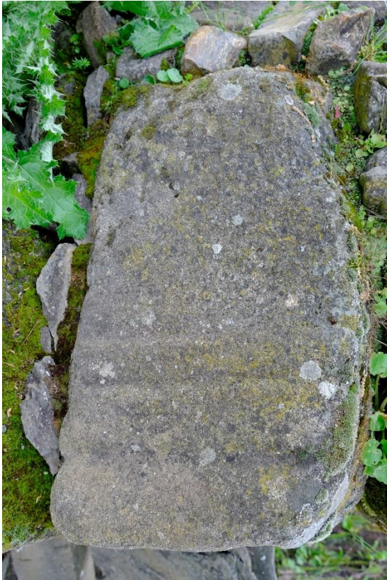
Fig. 11. Inscripti3n romana