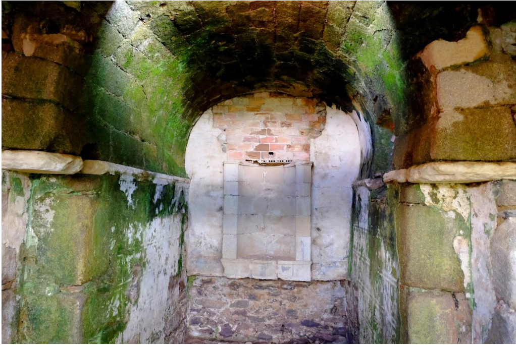
Fig. 7. Cabecera de la ermita