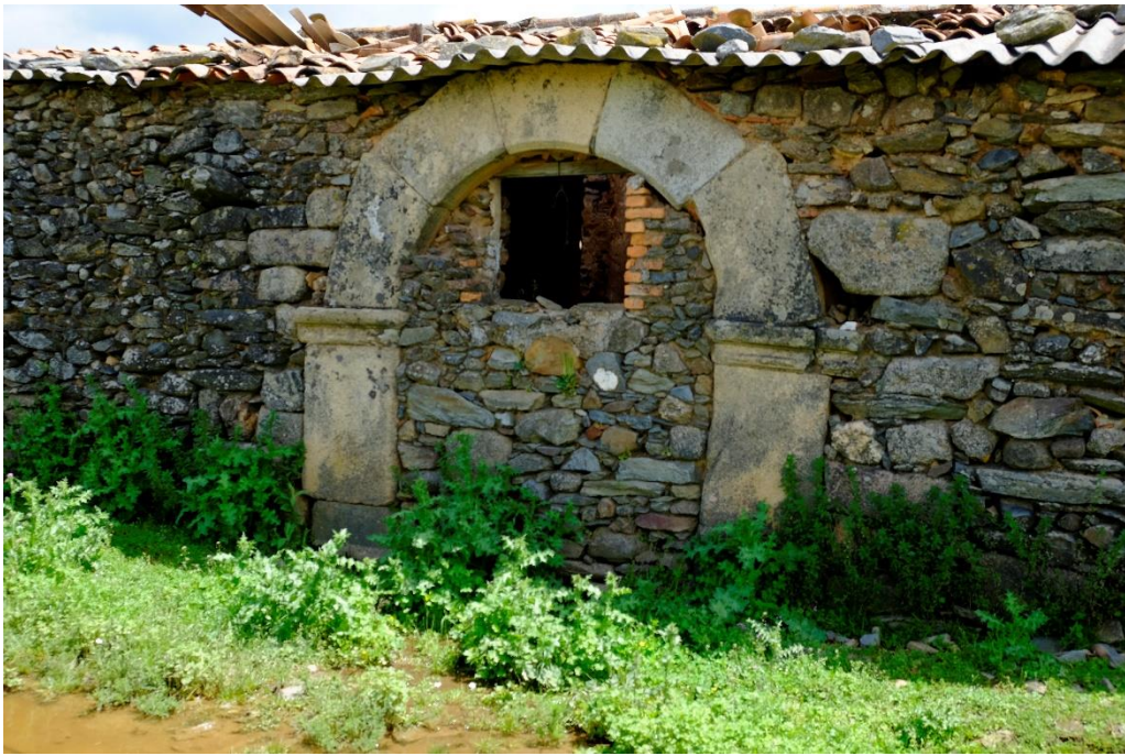
Fig. 3. Portada