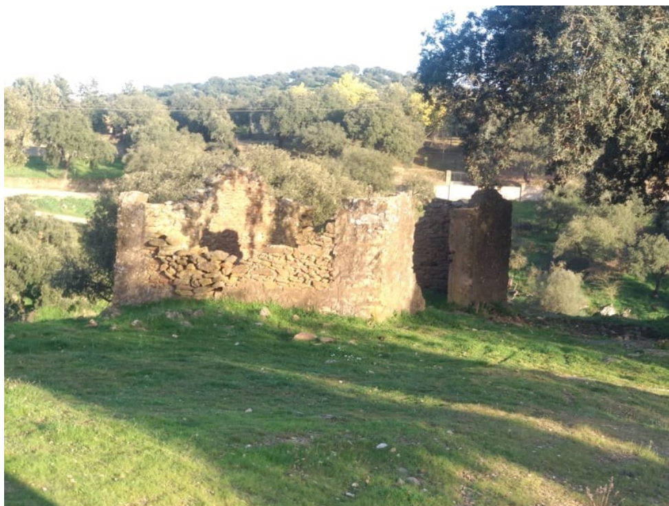
Imagen 2. Pedrizo de antigua choza