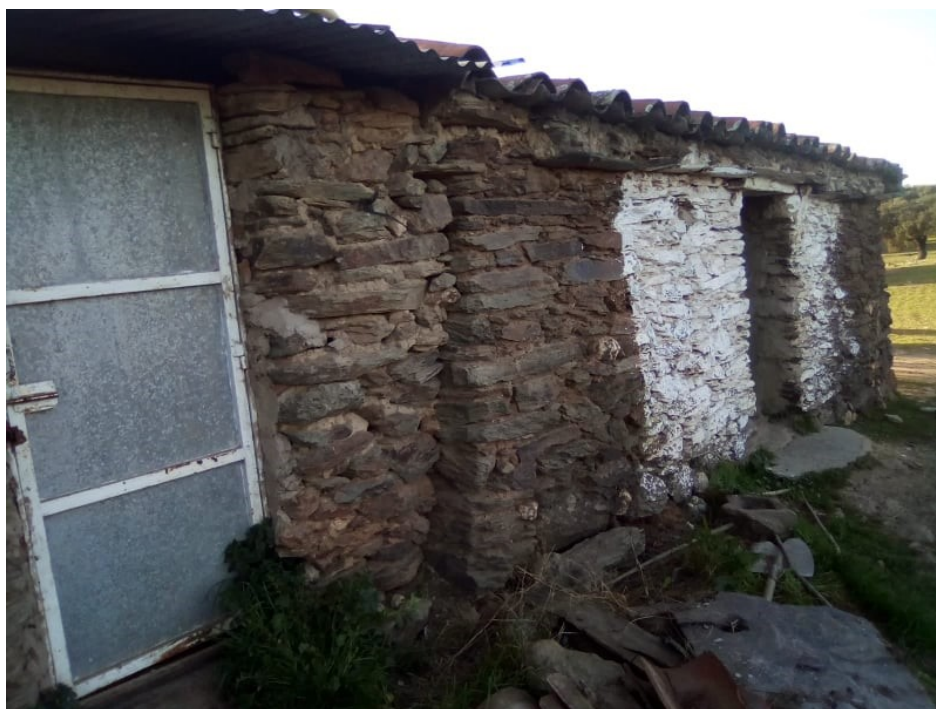
Imagen 3. Chozas remodeladas y aprovechadas para uso actual