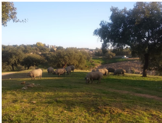
Imagen 5. Ganado porcino pastando en la dehesa