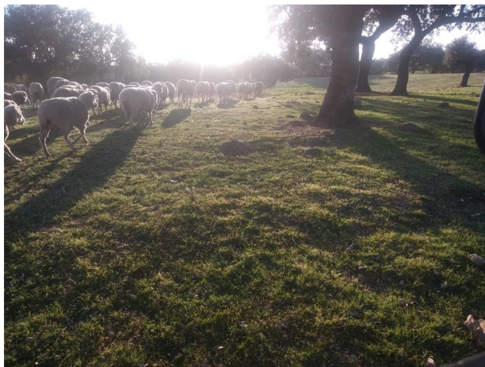
Imagen 6. Ganado ovino pastando en la dehesa