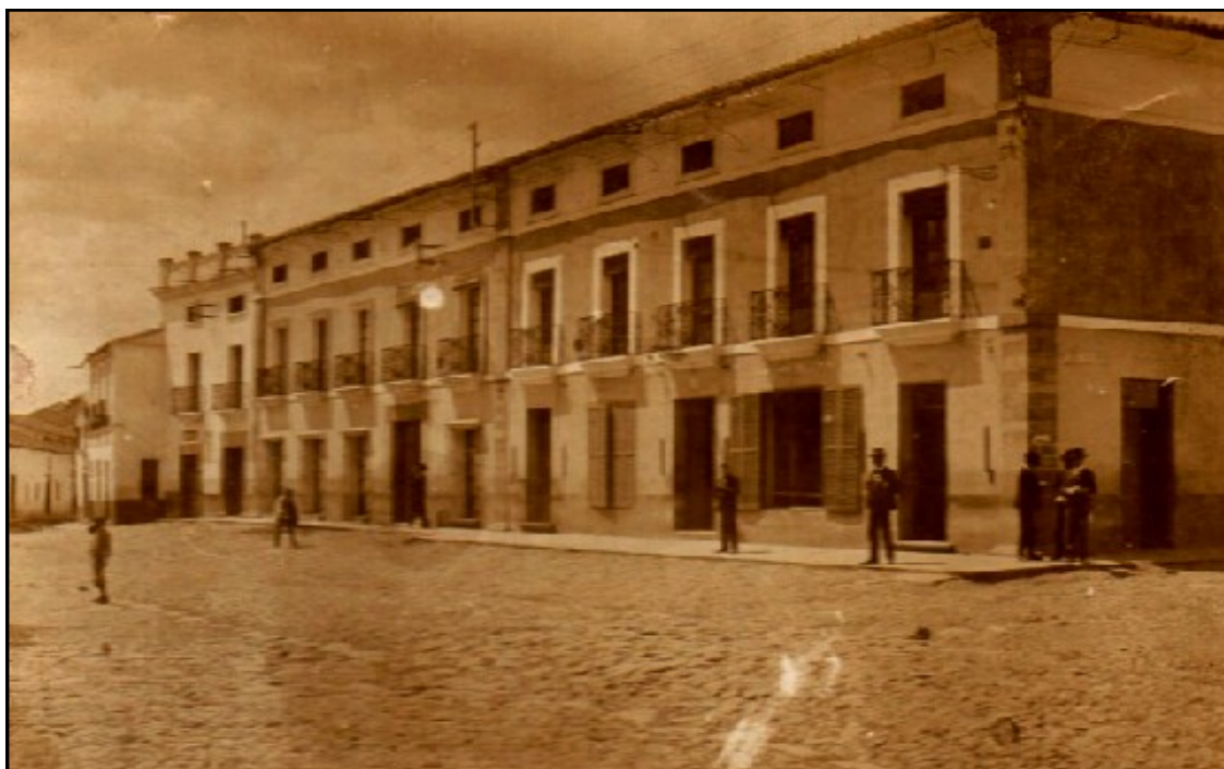
Imagen 10: Principios del siglo XX. Calle Groizard.