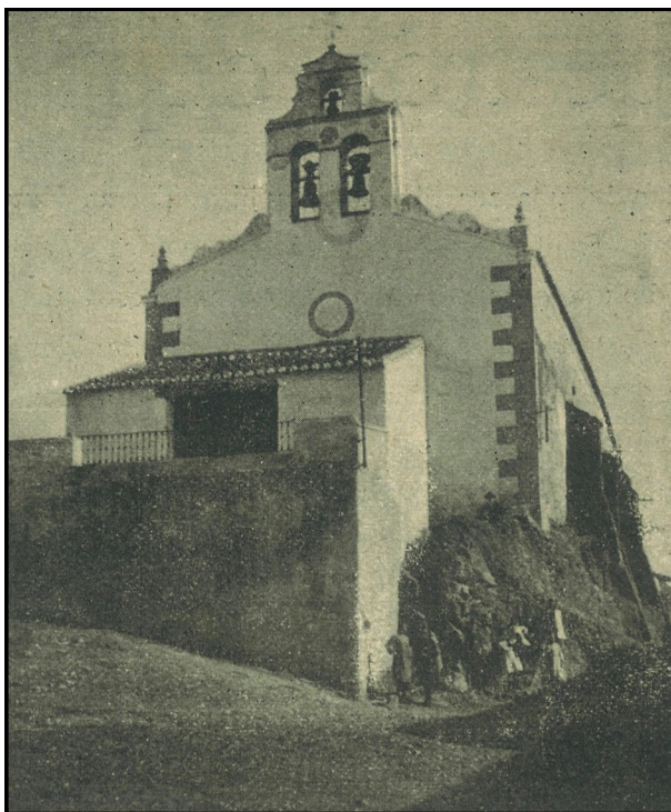
Imagen 1: Iglesia de San Sebastián en en año 1921.