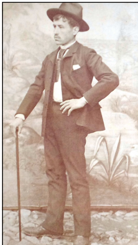
IMAGEN 2. EXCMO. SR. D. PEDRO LEONCIO NICOMEDES CAMPOS DE ORELLANA, PRIMER CONDE DE CAMPOS DE ORELLANA