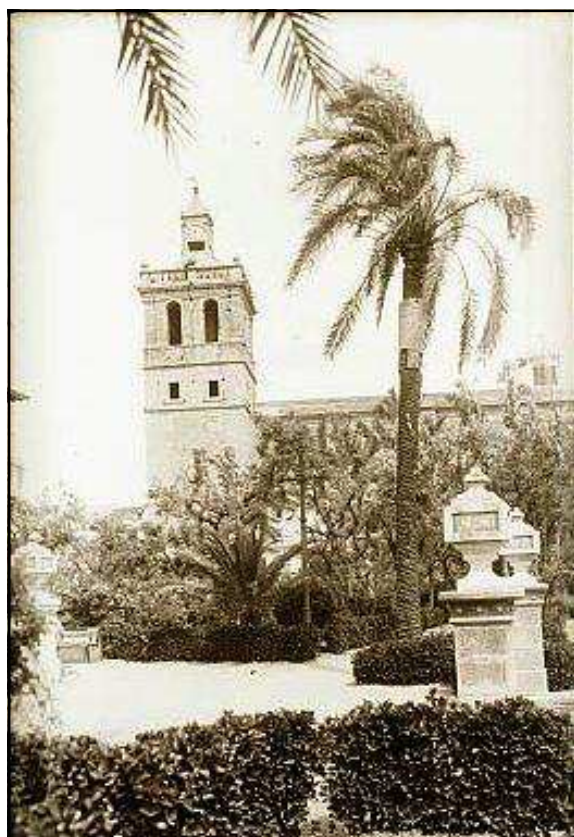
IMAGEN 10. AL FONDO LA PARROQUIA DE NUESTRA SEÑORA DE LA ASUNCIÓN DE VILLANUEVA DE LA SERENA (FOTO. Ediciones Arribas. Años 30)